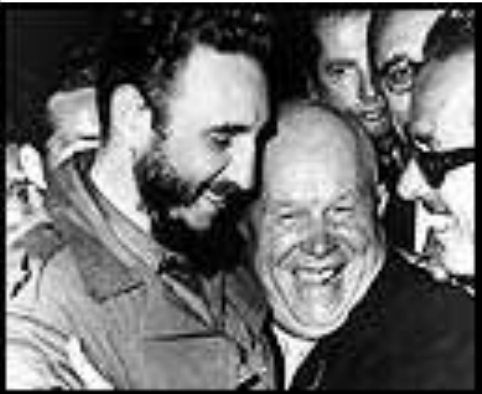
Fidel Castro og Nikita Khrustsjov