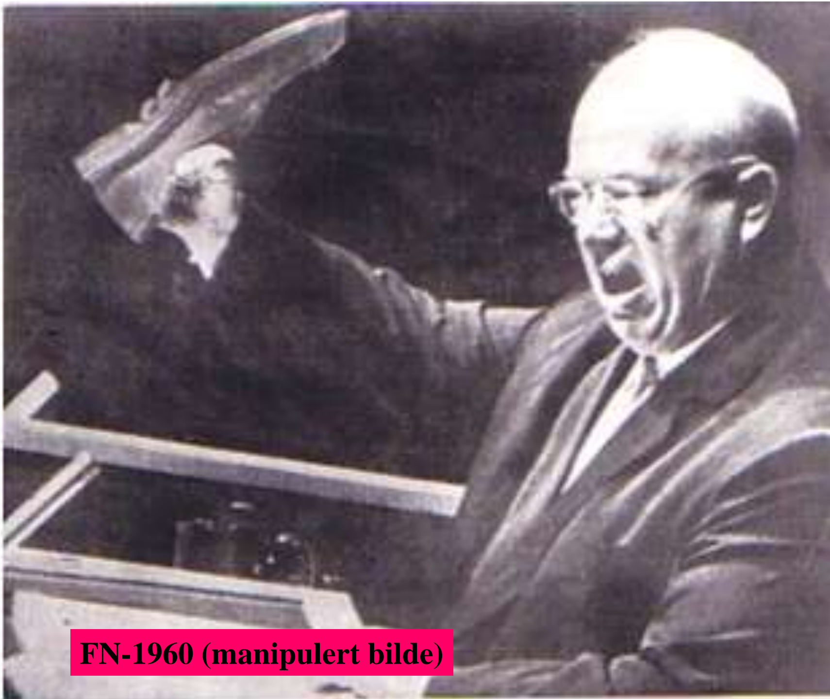
FN-1960 (manipulert bilde)