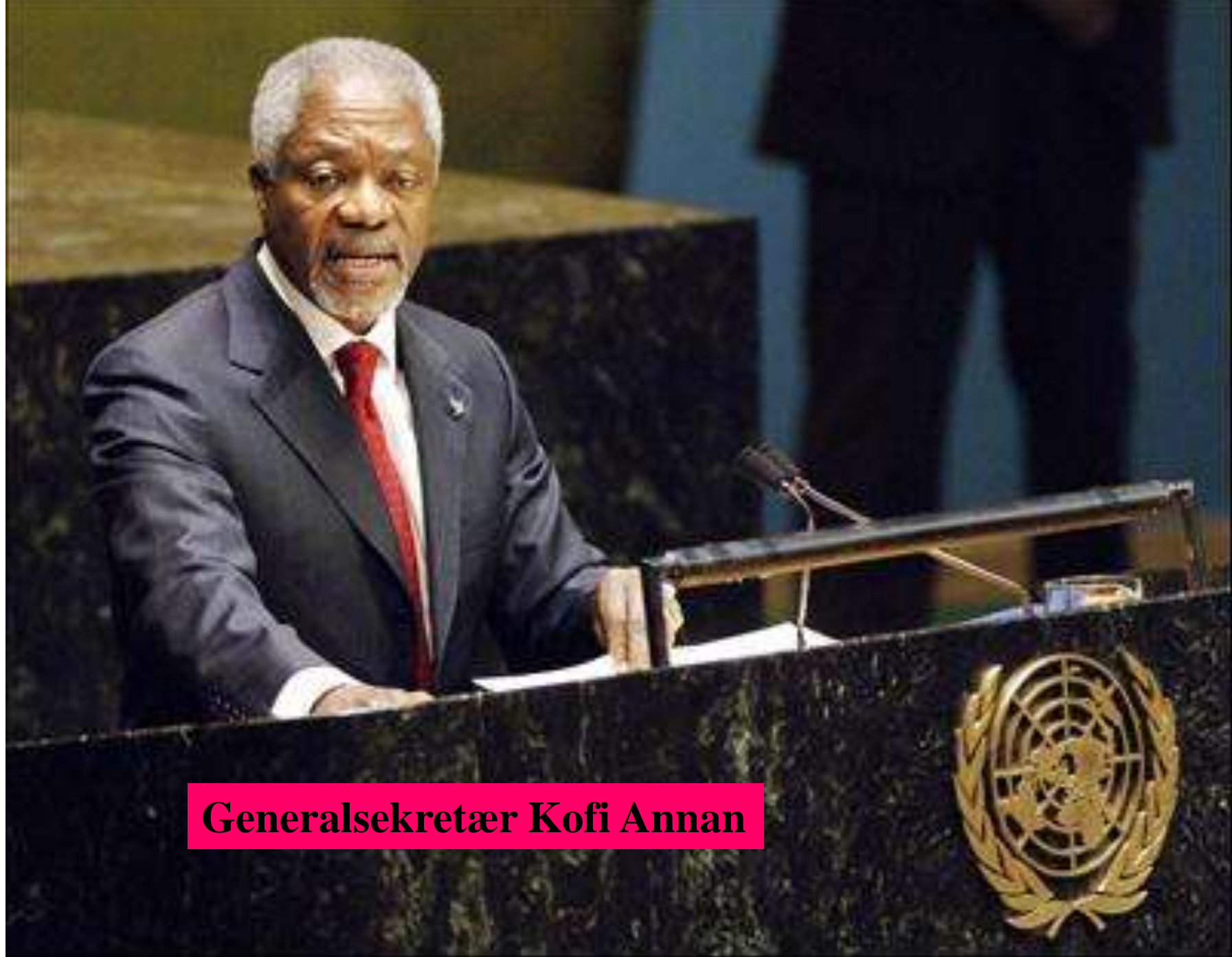
Generalsekretær Kofi Annan