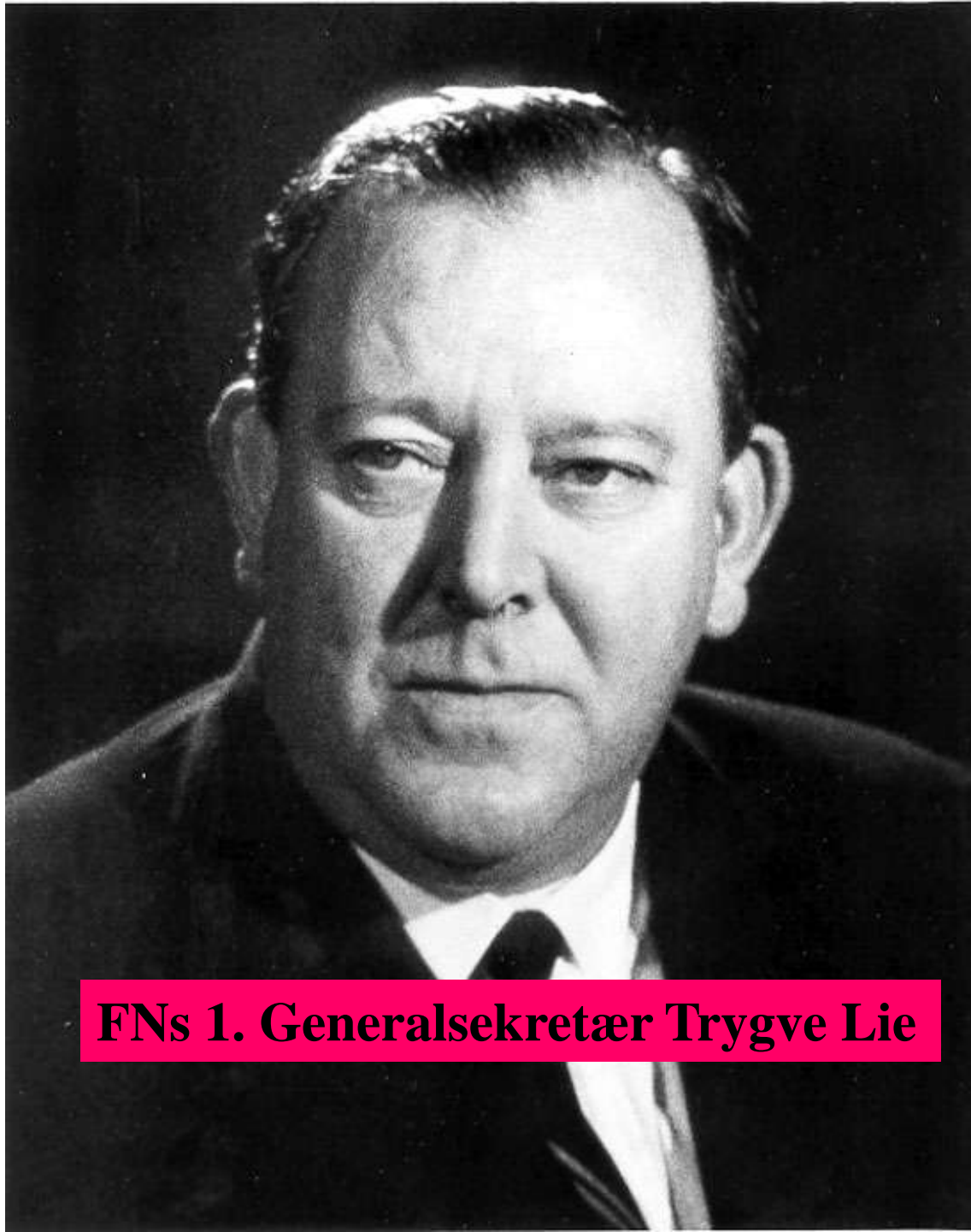
FNs 1. Generalsekretær Trygve Lie